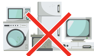
sprzętu RTV / AGD